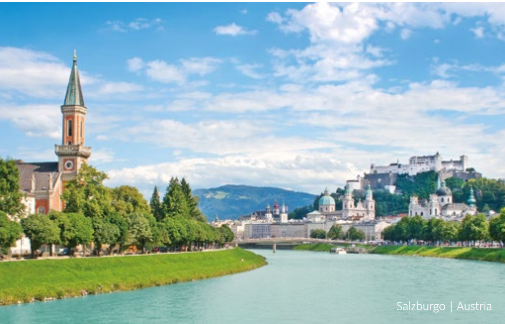
Salzburgo | Austria

Por la mañana salida hacia Múnich. En el camino parada a orillas del Lago Chiemsee. Llegada a Múnich por la tarde y fin de los servicios.