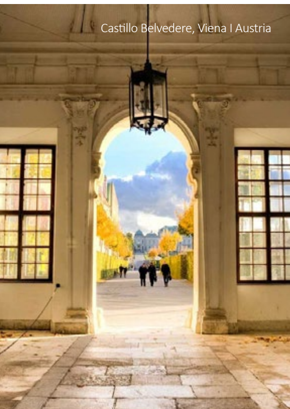
Castillo Belvedere, Viena | Austria