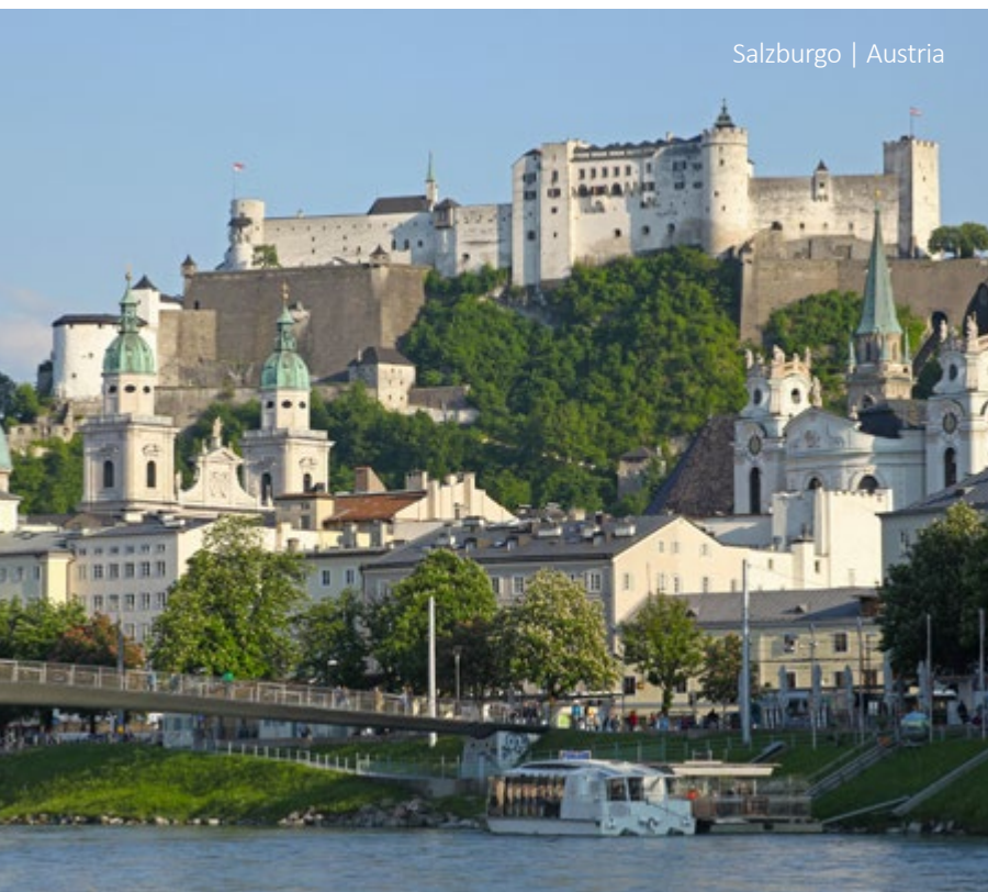
Salzburgo | Austria