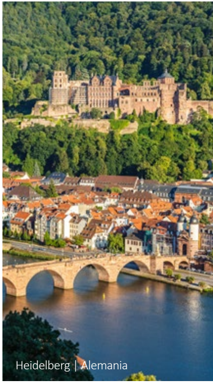
Heidelberg | Alemania

11 Zúrich Traslado del hotel al aeropuerto.