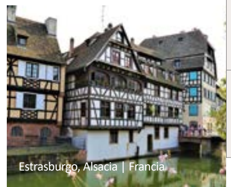
Estrasburgo, Alsacia | Francia