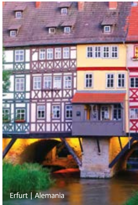
Erfurt | Alemania