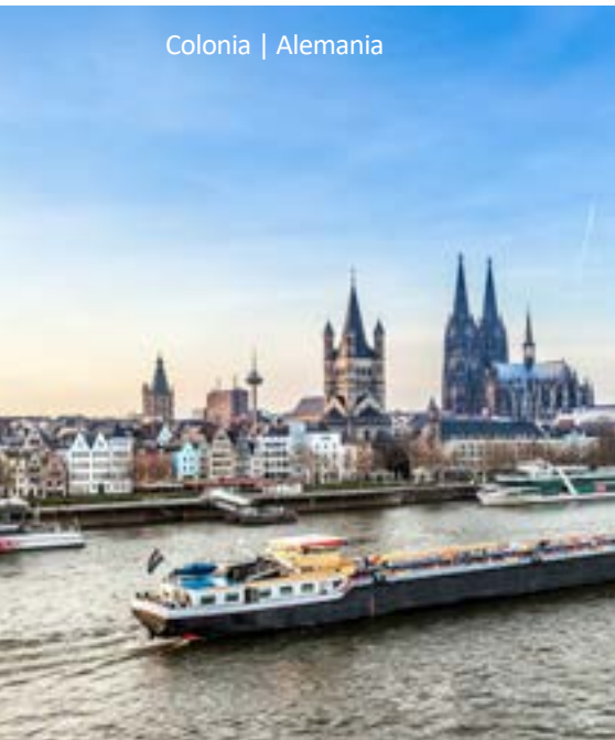
Colonia | Alemania

Después del desayuno tiempo libre para disfrutar la ciudad. Por la noche llegada a Frankfurt. Alojamiento en el Hotel Mövenpick Frankfurt****. El tour finaliza en el Aeropuerto de Frankfurt alrededor de las 19:00 horas. Después parada en el hotel Mövenpick para los pasajeros con noches extras. Fin de nuestros servicios.