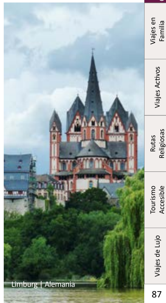
Limburg | Alemania