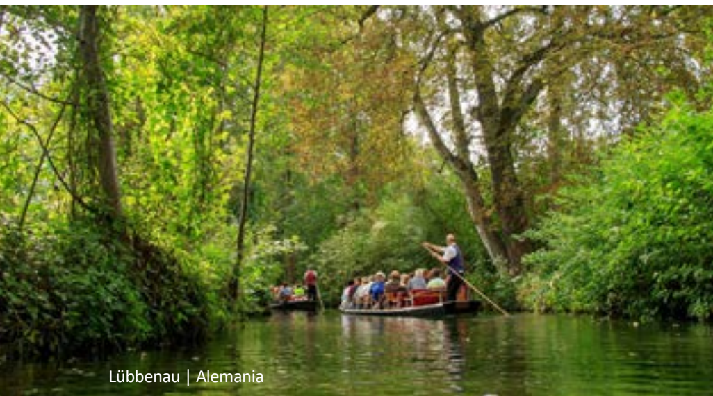
Lübbenau | Alemania