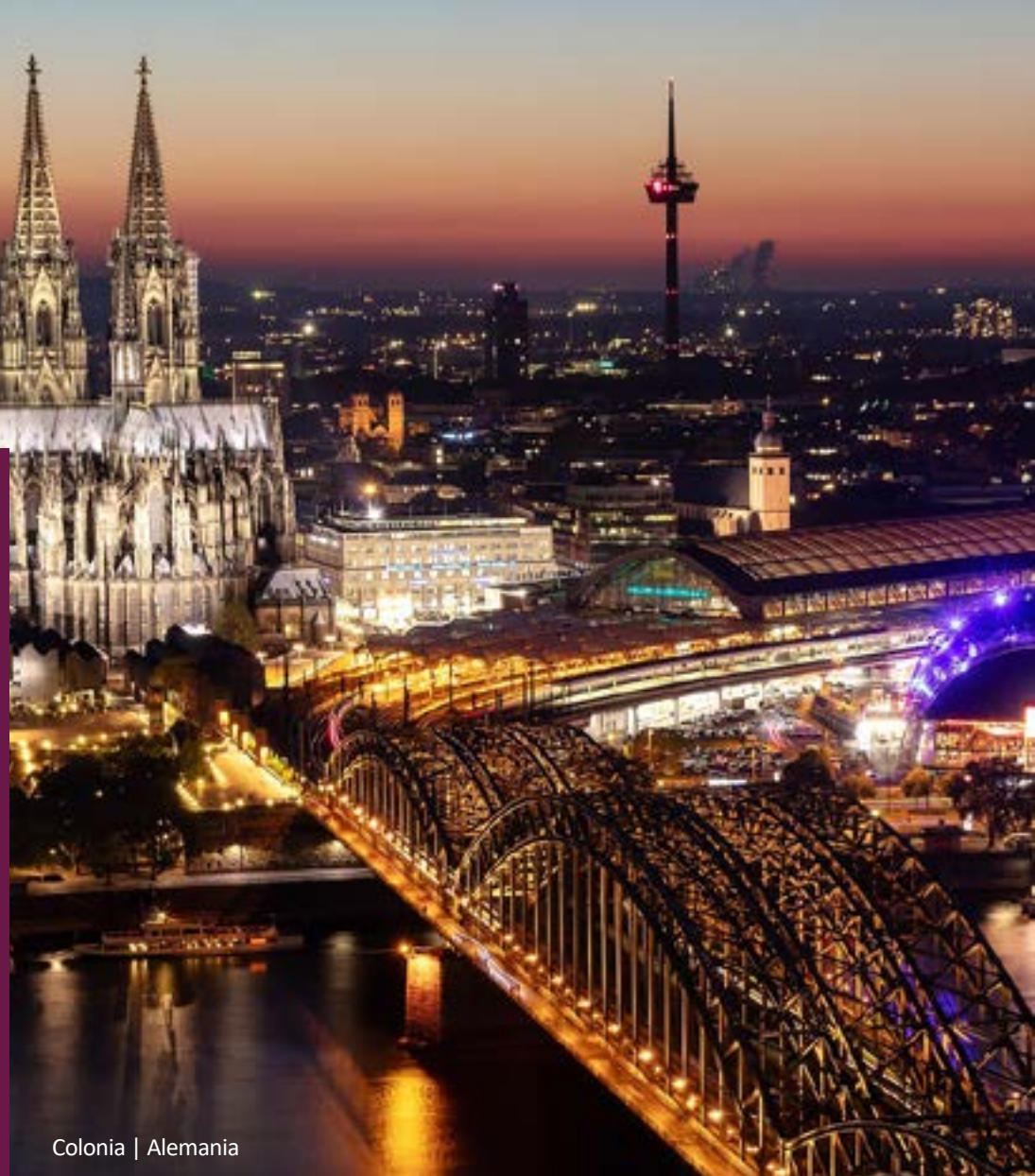
Colonia | Alemania

Tarjeta de crédito obligatoria. Es posible hacer el tour con otros aeropuertos de llegada/salida.