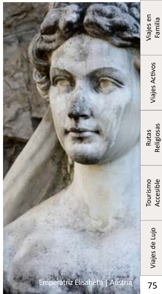
Emperatriz Elisabeth | Austria