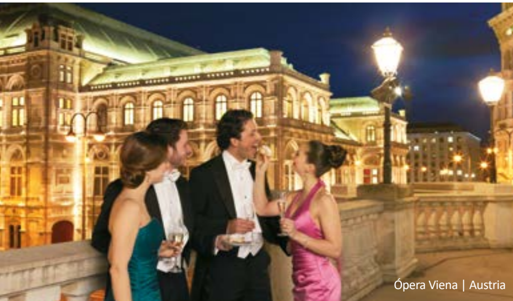
Ópera Viena | Austria