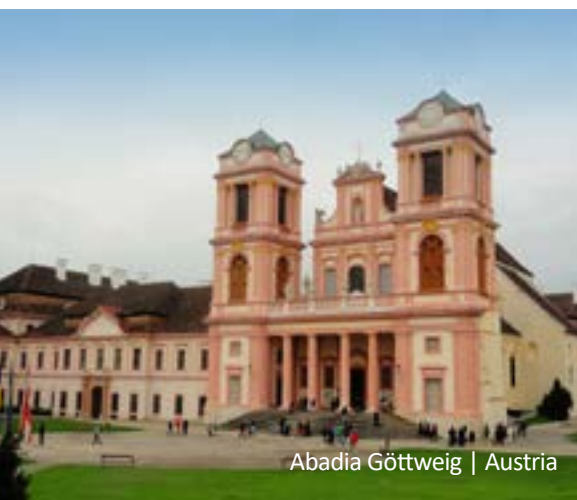
Abadía Göttweig | Austria