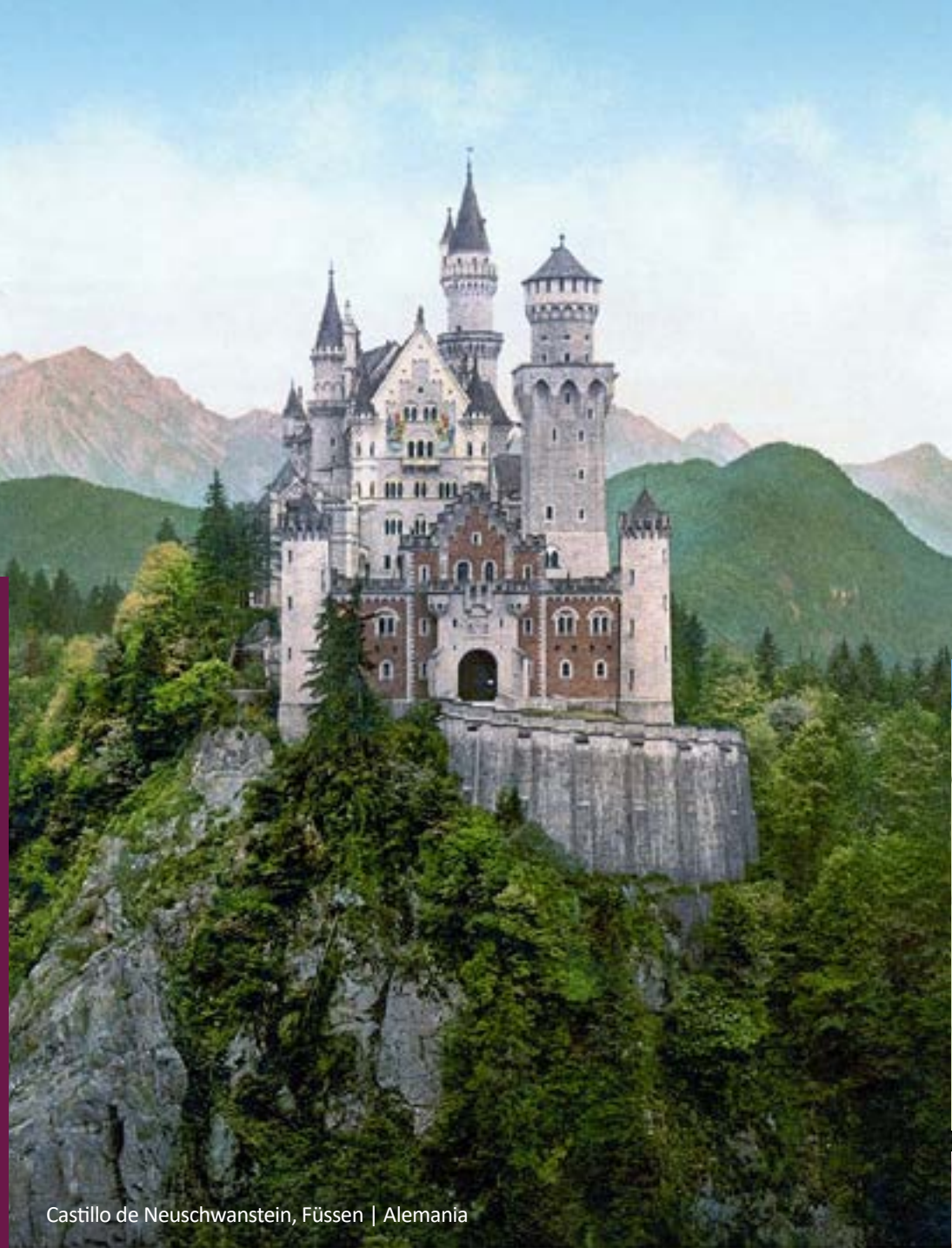
Castillo de Neuschwanstein, Füssen | Alemania

Guía, entradas, excursiones, gasolina, costos de estacionamiento, multas, neumáticos de invierno, GPS, Tasa One Way etc.