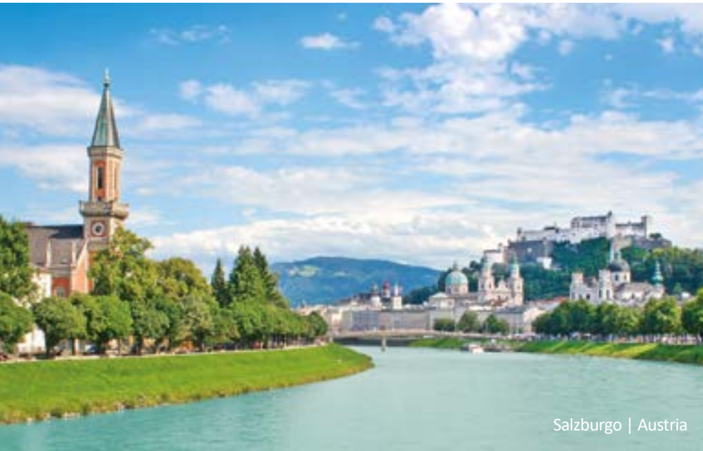
Salzburgo | Austria

Por la mañana salida hacia Múnich. En el camino parada a orillas del Lago Chiemsee. Llegada a Múnich por la tarde y fin de los servicios.