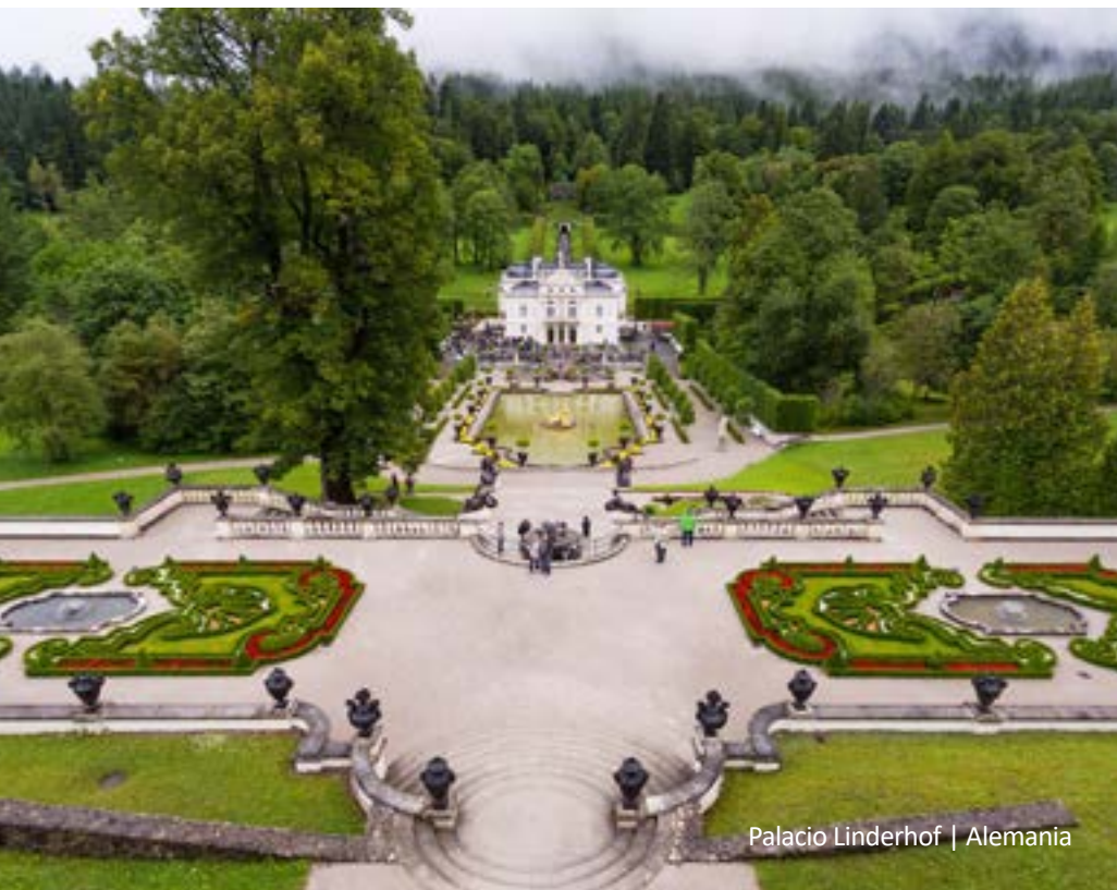
Palacio Linderhof | Alemania