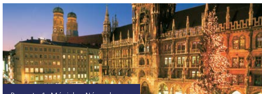
Paquete 1: Múnich y Núremberg