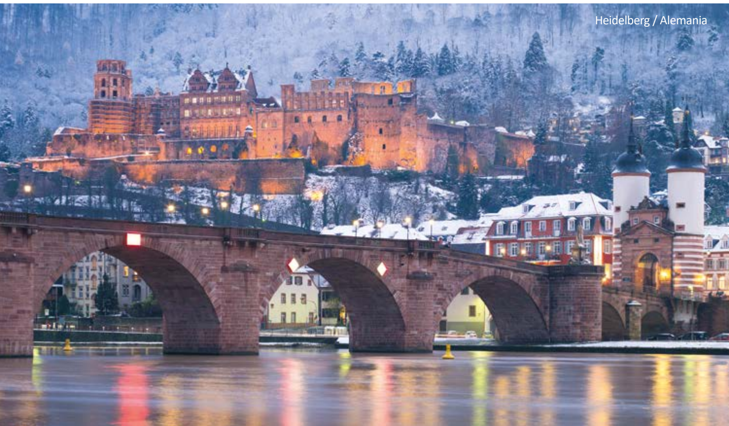
Heidelberg / Alemania